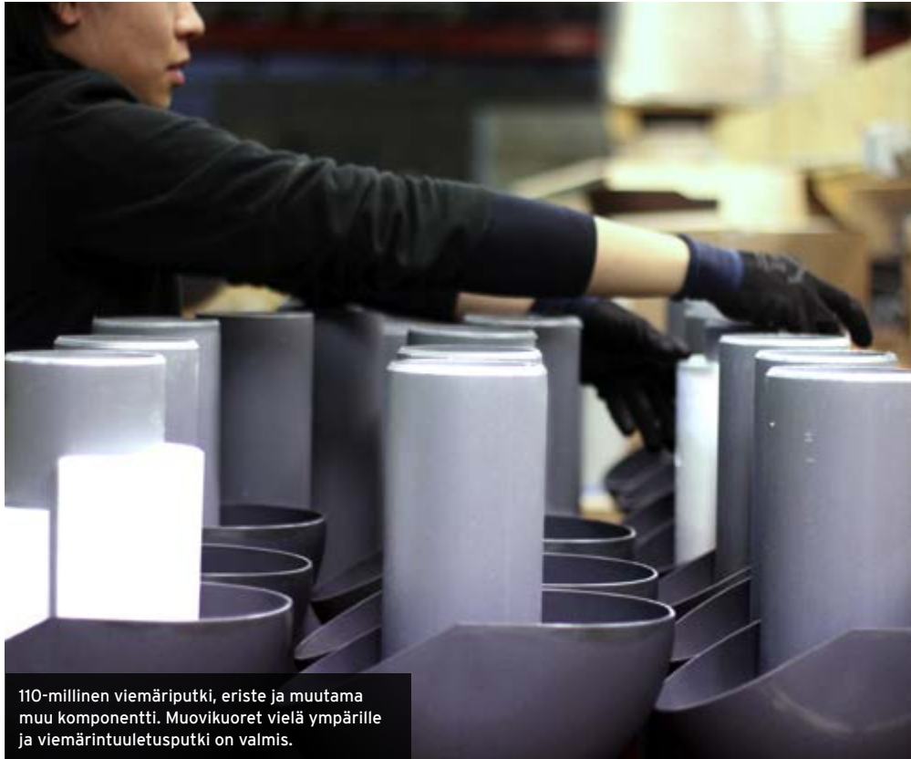
110-millinen viemäriputki, eriste ja muutama muu komponentti. Muovikuoret vielä ympärille ja viemärintuuletusputki on valmis.