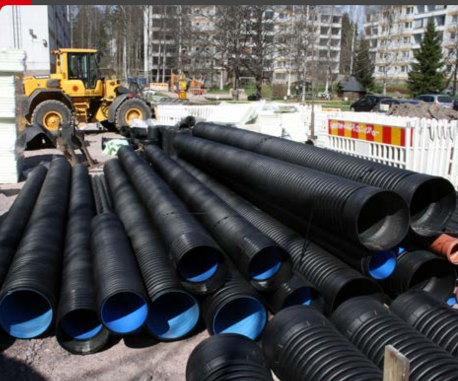
Meltexin rumpuputket ja mittatilauskaivot odottavat työmaalla pääsyä maan alle.