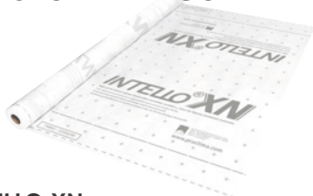
INTELLO XN Kosteutta ohjaava höyrynsulkukangas