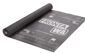
SOLITEX FRONTA WA Tuulensuojakankaat